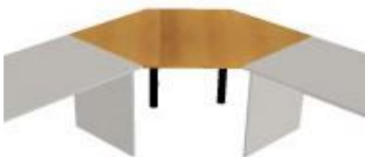
NS 844 deska rohová 1600x99x18

NS 820 rohová noha NS 837 noha desková NS 839 trnož 765 úhelník kovový ST noha kovová CN centrální noha KN křížová noha