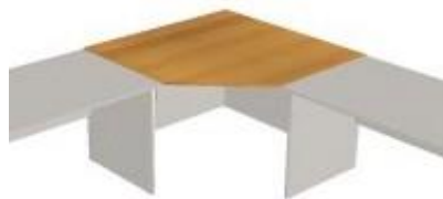
NS 829 deska rohová rovná 1130x1130x18