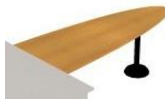
NS JE 183