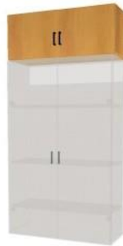
NS 882 nástavec dvoudveřový 900x400x400