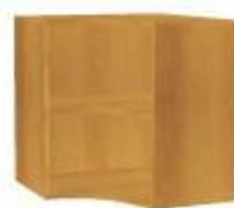
NS 078N rohová vnitřní 700x700x800