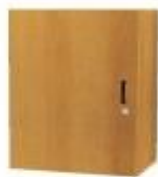
NS 861L jednodveřová s policí levá NS 861P jednodveřová s policí pravá