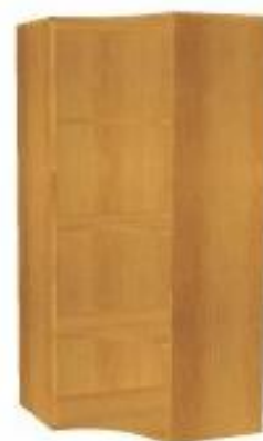
NS 078V rohová vnitřní 700x700x1600