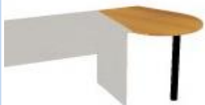
NS 960J L,P