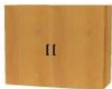
NS 891 dvoudveřová s policí