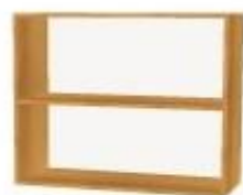
NS 893 otevřená