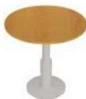
NS 826 deska kruhová průměr 650

Opatřena nohou centrální NC výška 720 NC výška 550