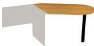
NS 945J L,P