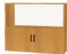
NS 891 dvoudveřová s nikou