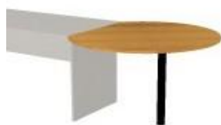
NS 843 deska jednací 1100x970x18