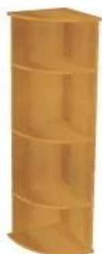
NS 049V koncová 400x400x1600