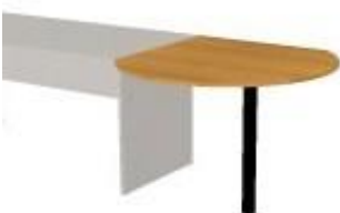
NS 825 deska výkroj 90° 700x900x18