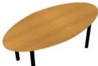
NS JE 181