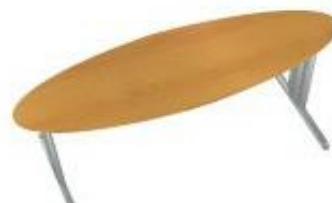
NS JE 161