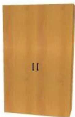
NS 891V dvoudveřová 3 police