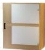
NS 867L jednodveřová sklo levá NS 867P jednodveřová sklo pravá