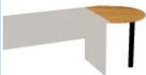
NS 930J L,P