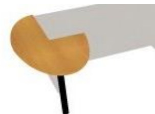
NS JE 141 výřez