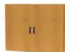
NS 895 registr dveřový