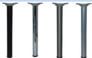
SN noha stavěcí