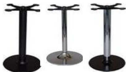
CN centrální noha

litinová základna 450mm ocelová roura průměr 80mm