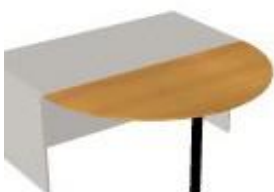
NS 841 deska jednací velká 1400x700x18