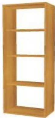
NS 873 otevřená 3 police