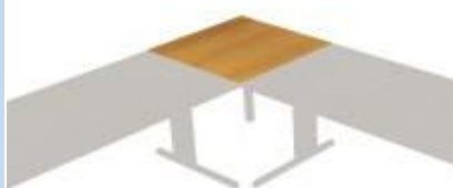
NS 746 deska čtvercová