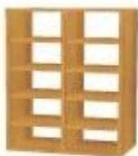
NS 865 registr otevřený