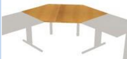
NS-25 744 deska rohová