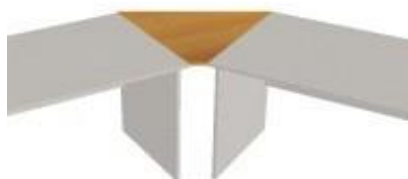
NS 851 deska rohová 60° 743x743x18