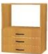
NS 863 zásuvková