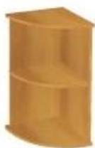
NS 049N koncová 400x400x800