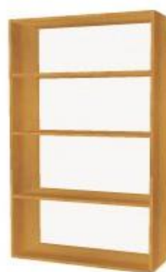
NS 893 otevřená 3 police