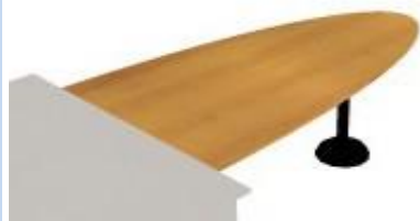
NS JE 182