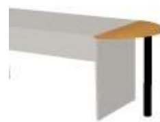
NS 842 deska jednací malá 700x700x18