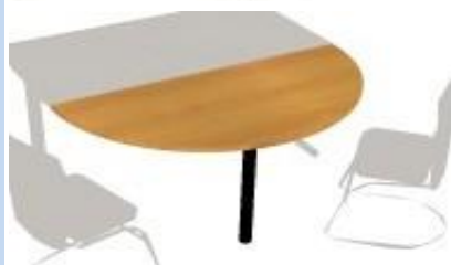
NS 741 deska jednací velká