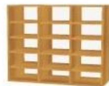
NS 894 registr otevřený