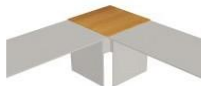
NS 846 deska čtvercová 700x700x18