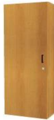
NS 872L šatní s výsuvem levá NS 872P šatní s výsuvem pravá