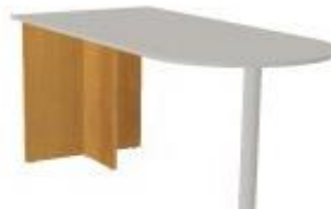
NS 837 noha desková 600x300x730