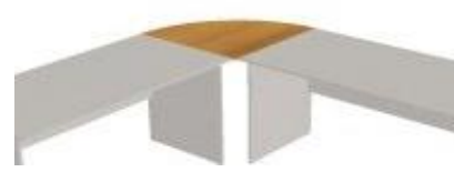
NS 848 deska rohová 90° 735x735x18