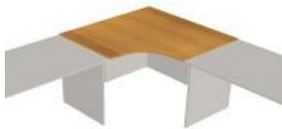
NS 829 deska rohová 1130x1130x18