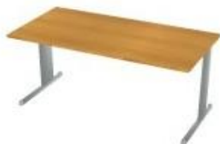
NS-25 731f stůl pracovní 1600x750x750 NS-25 731! stůl pracovní 1500x750x750 NS-25 731 stůl pracovní 1400x750x750 NS-25 732 stůl pracovní 1200x750x750 NS-25 733 stůl pracovní 800x750x750