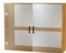
NS 896 dvoudveřová sklo