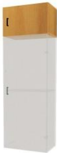
NS 881 nástavec jednodveřový 600x400x400