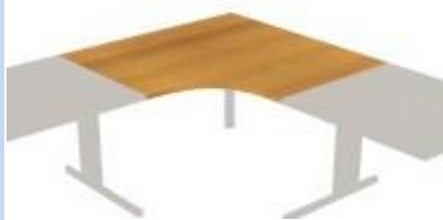
NS-25 729 deska rohová