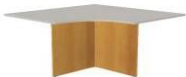
NS 820 noha desková 600x600x730