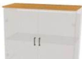
deska krycí NS 406 600x400x18 NS 409 900x400x18 NS 412 1200x400x18 NS 415 1500x400x18 NS 418 1800x400x18 NS 421 2100x400x18 NS 424 2400x400x18