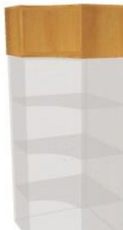
NS 078NN rohová vnitřní 700x700x400