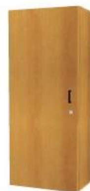
NS 871L jednodveřová 3 police levá NS 871P jednodveřová 3 police pravá