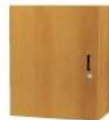
NS 866L registr dveřový levý NS 865P registr dveřový pravý