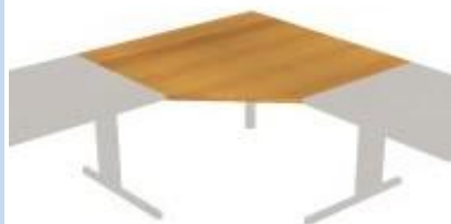
NS-25 729f deska rohová rovná