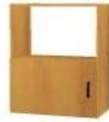
NS 862L jednodveřová s nikou levá NS 862P jednodveřová s nikou pravá