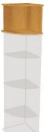
NS 049NN koncová 400x400x400