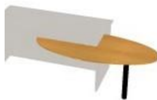
NS JE 142 výřez