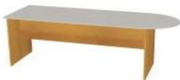
NS 839 trnož desková 1750x600x730