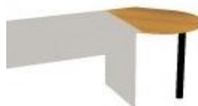
NS 945J L,P