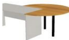
NS 824 deska jednací výšeč 270° průměr 1400