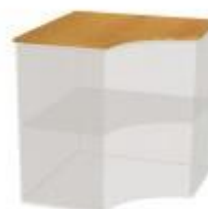
NS DK 7 deska krycí na 078 700x700x18