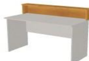
NS 810 police na stůl 1400x200x220 NS 811 police na stůl 1200x200x220 NS 812 police na stůl 800x200x220