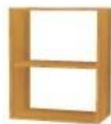
NS 864 otevřená