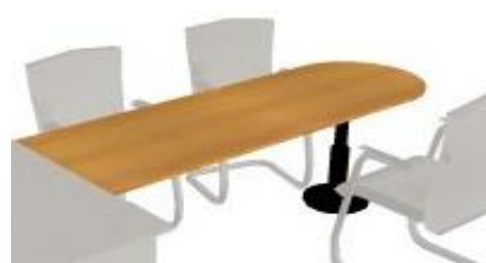
NS 838 deska jednací 2100x700x18