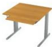
NS-25 734 stůl pracovní s výsuvem 800x750x750